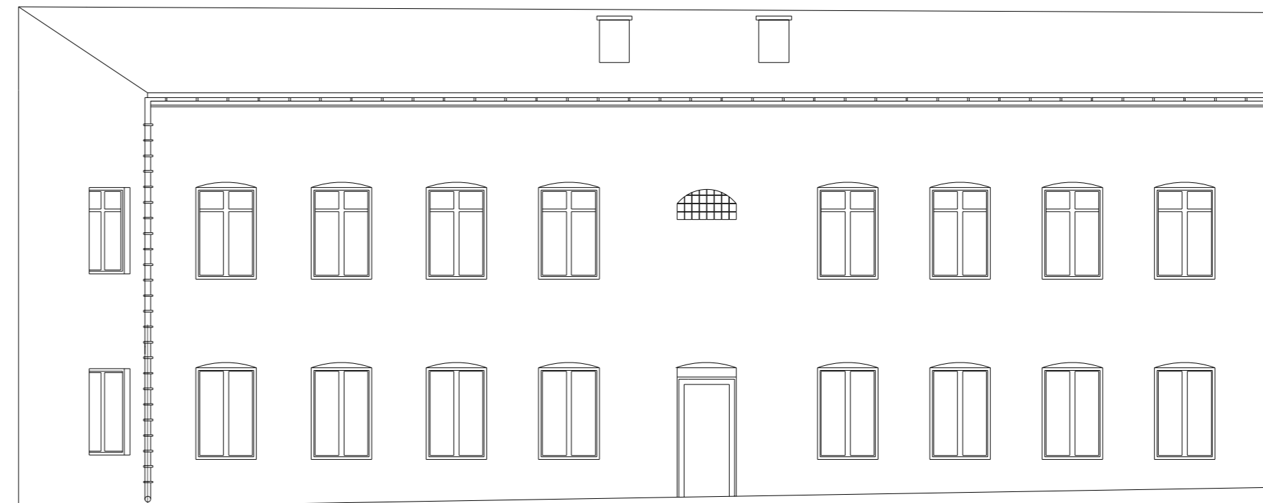
ELEWACJA PÓLNOCNO - WSCHODNIA